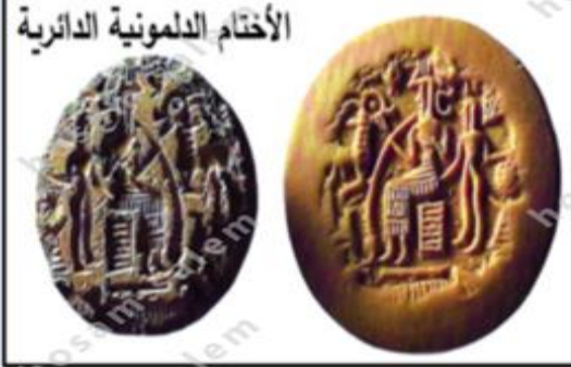
الأختام الدلمونية الدائرية

كان مركزها قبل خمسة آلاف سنة تقريباً في جزر البحرين وجزيرة تاروت في القطيف، وقد مثلت مركزاً استراتيجياً مهماً: فهي حلقة الوصل بين بلدان الشرق الأوسط والأدنى.