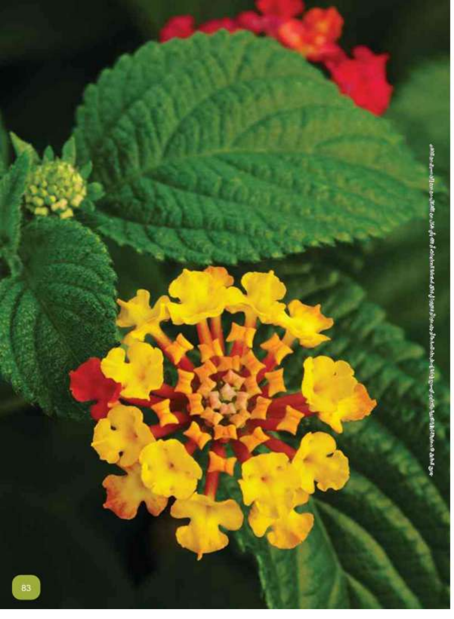
Photo: Lantana camara (Lantana) - a species of flowering plant in the family Verbenaceae, native to the Americas and the Caribbean. It is a common and invasive species in many parts of the world.