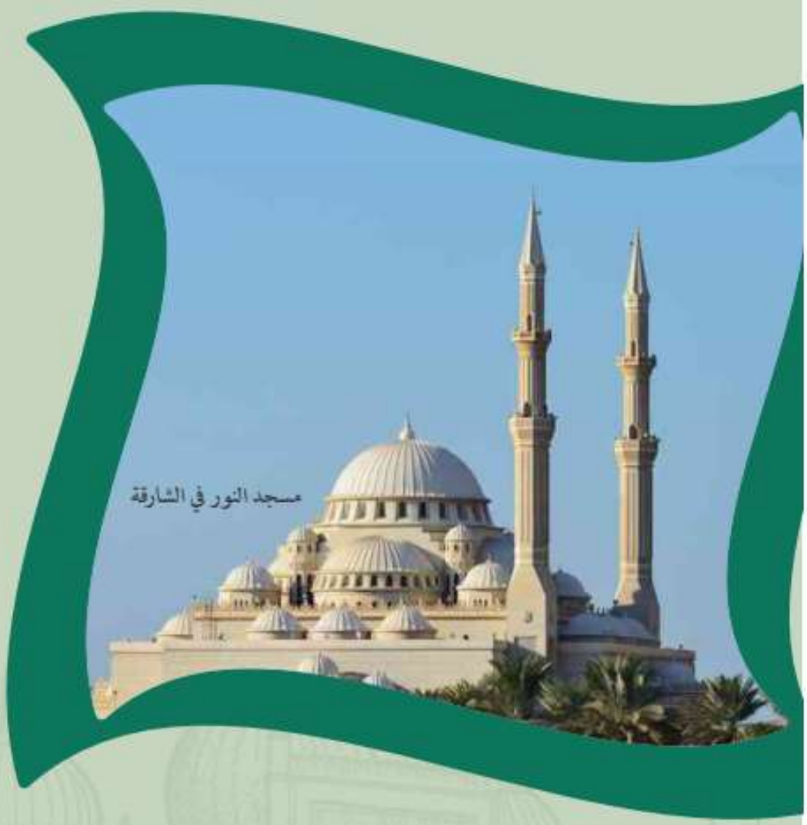
مسجد النور في الشارقة

جميع الحقوق محفوظة لدار الفکر للطباعة والنشر والتوزيع - بيروت - لبنان