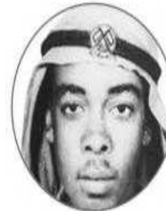
الشهيد سالم سهيل خميس

لَقَدْ كَانَ أَوَّلَ الشَّهَدَاءِ الَّذِينَ رَوَوْا بِدَمَائِهِمُ الزَّكِيَّةَ تَرَبُّةَ الْوَطَنِ، وَقَبْرَهُ شَاهِدٌ عَلَى ظَلَمِ الْغَزَاةِ الْمُعْتَدِينَ، وَقَدْ أَمَرَ صَاحِبُ السَّمَوِ السَّيِّحُ خَلِيفَةُ بْنُ زَايِدٍ آلَ نَهْيَانَ رَئِيسُ دَوْلَةِ الْإِمَارَاتِ الْعَرَبِيَّةِ الْمُتَّحِدَةِ - حَفَظَهُ اللَّهُ - بِتَحْدِيدِ يَوْمِ 30 نَوَفَمْبَرٍ مِنْ كُلِّ عَامٍ يَوْمًا رَسْمِيًّا لِجَمِيعِ شُهَدَاءِ الدَّوْلَةِ تَحْتَ مُسَمًّى (يَوْمَ الشَّهِيدِ) الَّذِي يَصَادَفُ يَوْمَ اسْتِشْهَادِ سَالِمٍ سَهِيلٍ أَوَّلِ شَهِيدٍ إِمَارَاتِيٍّ.