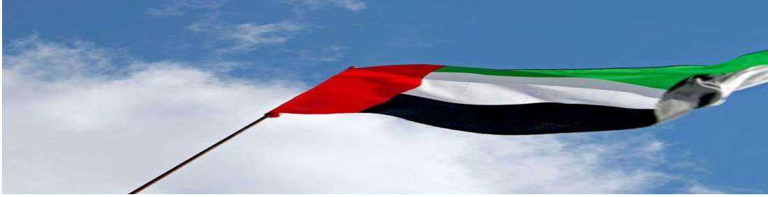
دَوْلَةُ الْإِمَارَاتِ الْعَرَبِيَّةِ الْمُتَّحِدَةِ

السؤال الأول: اقرأ النَّصَّ الَّذِي بِعُنْوَانِ: (دولة الإمارات العربية المتحدة) ثُمَّ أَجِبْ عَنِ الْأَسْئَلَةِ الَّتِي تَلِيهِ: