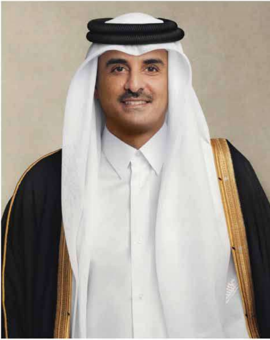
حضرة صاحب السمو الشيخ تميم بن حمد آل ثاني أمير دولة قطر

قَسَمًا بِمَنْ رَفَعَ السَّمَاءَ * قَسَمًا بِمَنْ نَشَرَ الضِّيَاءَ قَطَرٌ سَتَبْقَى حُرَّةً * تَسْمُو بِرُوحِ الْأَوْفِيَاءِ سِيرُوا عَلَى نَهْجِ الْأَلَى * وَعَلَى ضِيَاءِ الْأَنْبِيَاءِ قَطَرٌ بِقَلْبِي سِيرَةٌ * عِزٌّ وَأَمْجَادُ الْإِبَاءِ قَطَرُ الرِّجَالِ الْأَوَّلِينَ * حُمَاتُنَا يَوْمَ النَّدَاءِ وَحَمَائِمُ يَوْمِ السَّلَامِ * جَوَارِحُ يَوْمِ الْفِدَاءِ