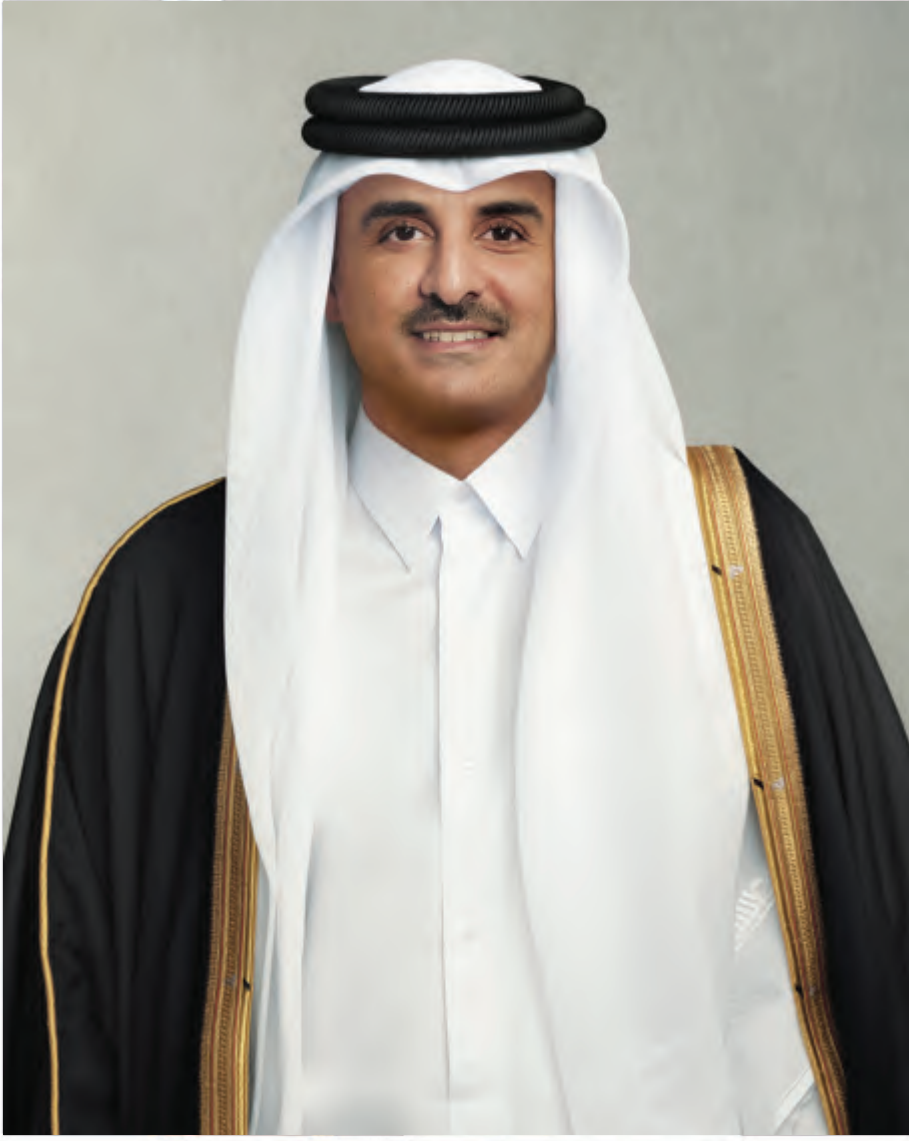
حضرة صاحب السمو الشيخ تميم بن حمد آل ثاني أمير دولة قطر