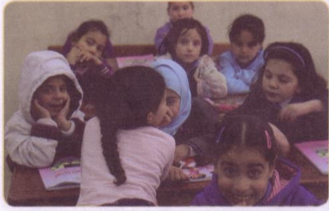
(٢) إحداث فوضى في الصف.