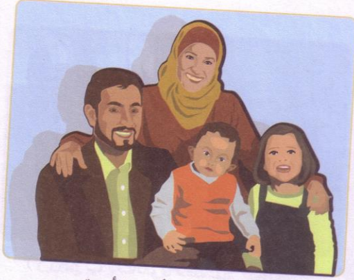
(٢) الوالدان وأفراد الأسرة.