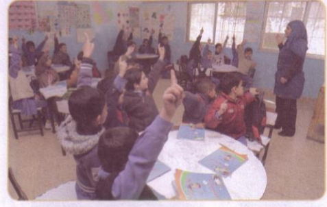
(١) طلاب يستأذنون معلمتهم للحديث.