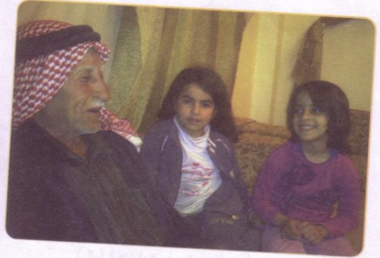
(٣) كبار السن.