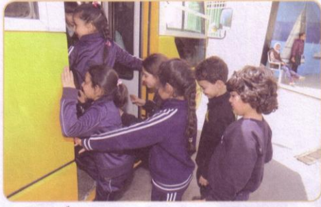
(١) ركوب الحافلة بصورة غير منظمّة.