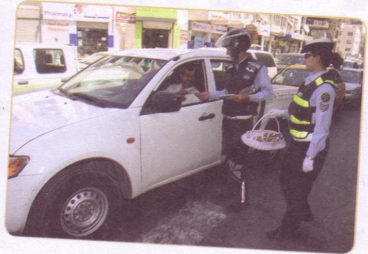
(٥) أفراد الأمن العام.