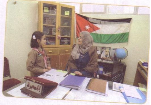
(١) مديرة المدرسة.