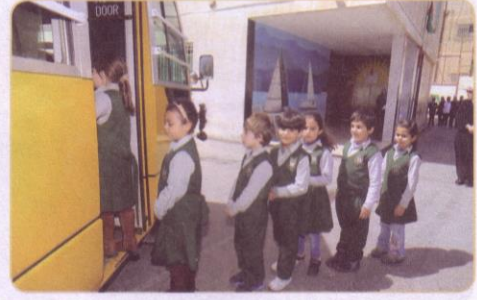
(٢) احترام دور الآخرين في أثناء ركوب الحافلة.