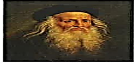
ليوناردو دا فنشي

(32) أي من الآتي الحقيقة الصحيحة التي تربط الصورتين؟