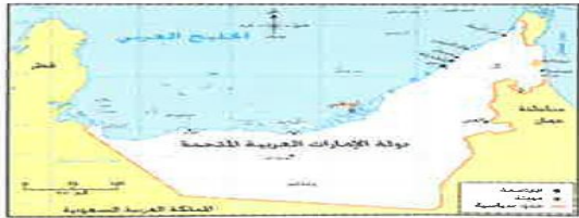
دولة الإمارات العربية المتحدة