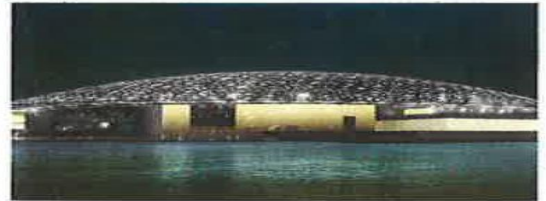
متحف اللوفر- أبوظبي

31) أي من الآتي الحقيقة الصحيحة التي تربط الصورتين؟