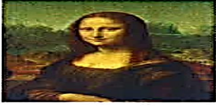
لوحة الموناليزا (الجيوكوندا)