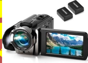
Video Camera كاميرا الفيديو