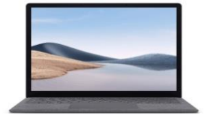
Laptops الحاسوب المحمول