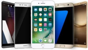
Smart Phones الهواتف الذكية

** ( يأتي هذا السؤال على شكل وصل أو ضع دائرة )