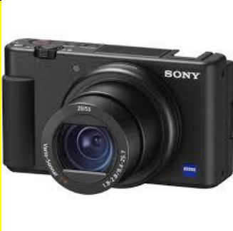
Digital Camera الكاميرا الرقمية

** ( يأتي هذا السؤال على شكل وصل أو ضع دائرة )