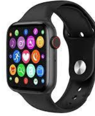
Smart Watch الساعة الذكية