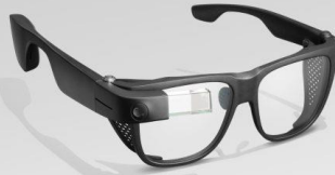
Smart Glasses النظارة الذكية