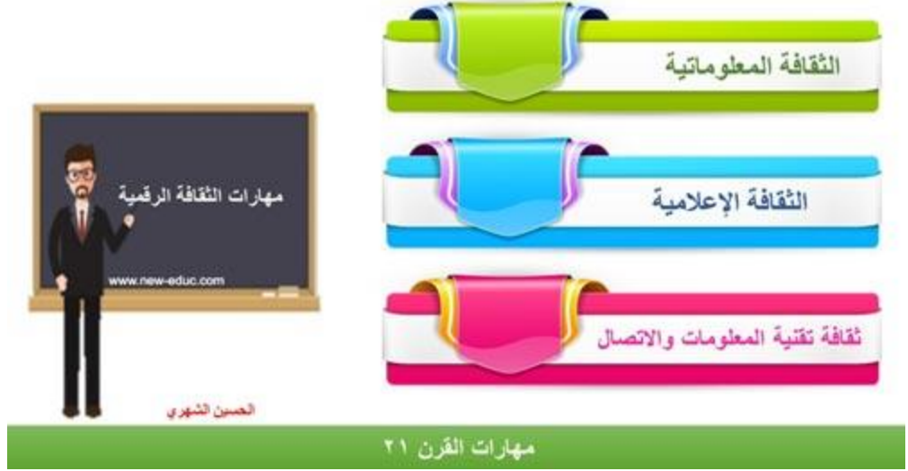
شكل (٢) مهارات الثقافة الرقمية