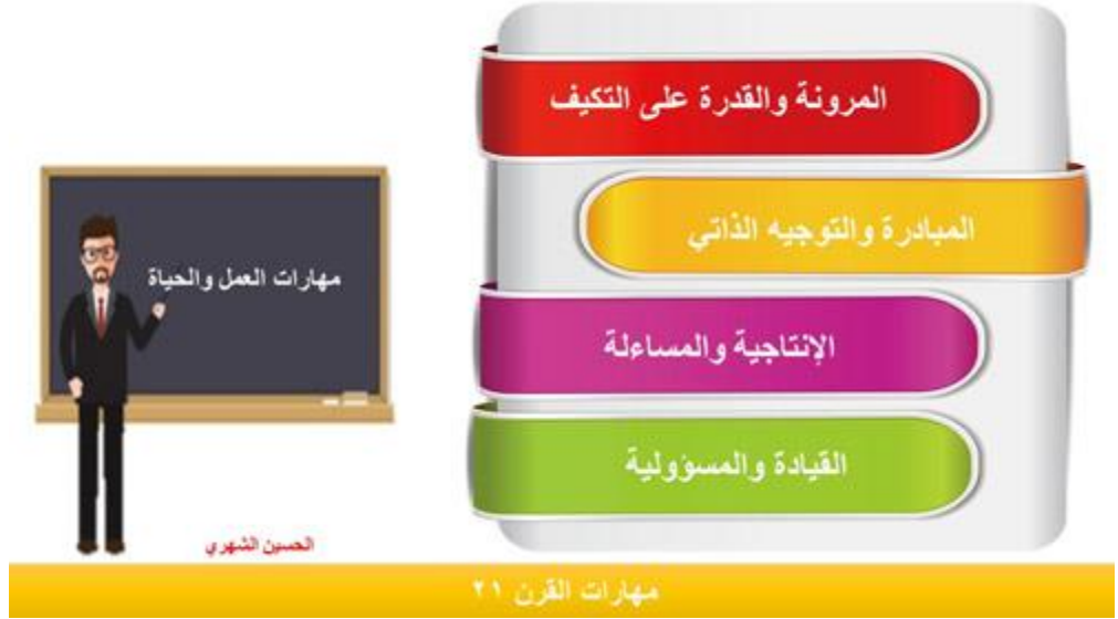
شكل (٣) مهارات العمل والحياة