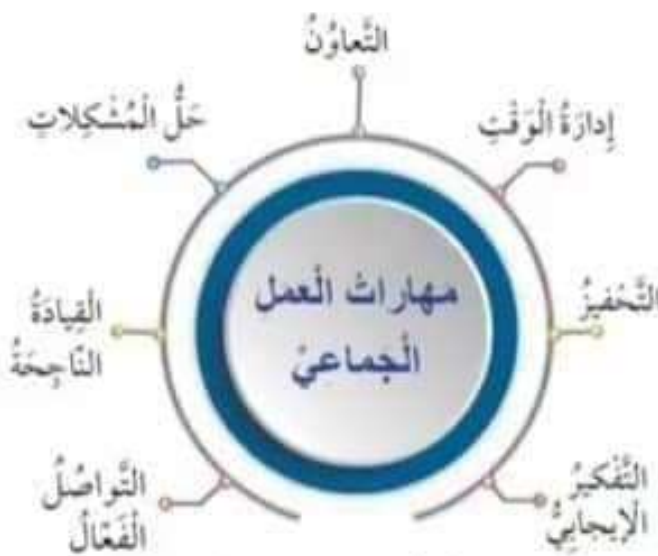
الشكل (1): مهارات العمل الجماعي.

العمل الجماعي: هو تعاون بين أفراد أو مجموعات على تحقيق هدف مشترك، عن طريق إسهام كل فرد بخبراته ومهاراته لتحقيق النجاح. ولاتعرف مهارات العمل الجماعي أتأمل الشكل المجاور.