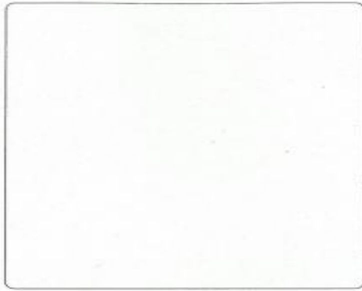
صَاحِبِ السُّمُوِّ الشَّيْخِ مُحَمَّدَ بْنِ زَايِدِ آلِ نَهْيَانَ

أَلَصَقُ صُورَةَ رَئِيسِ دَوْلَةِ الْإِمَارَاتِ الْعَرَبِيَّةِ الْمُتَّحِدَةِ صَاحِبِ السُّمُوِّ الشَّيْخِ مُحَمَّدَ بْنِ زَايِدِ بْنِ سُلْطَانِ آلِ نَهْيَانَ - حَفَظَهُ اللَّهُ، وَنَائِبِيهِ صَاحِبِ السُّمُوِّ الشَّيْخِ مُحَمَّدِ بْنِ رَاشِدِ آلِ مَكْتُومٍ - رَعَاهُ اللَّهُ - وَسَمُوِّ الشَّيْخِ مَنصُورِ بْنِ زَايِدِ آلِ نَهْيَانَ فِي الْمَكَانِ الْمُنَاسِبِ.