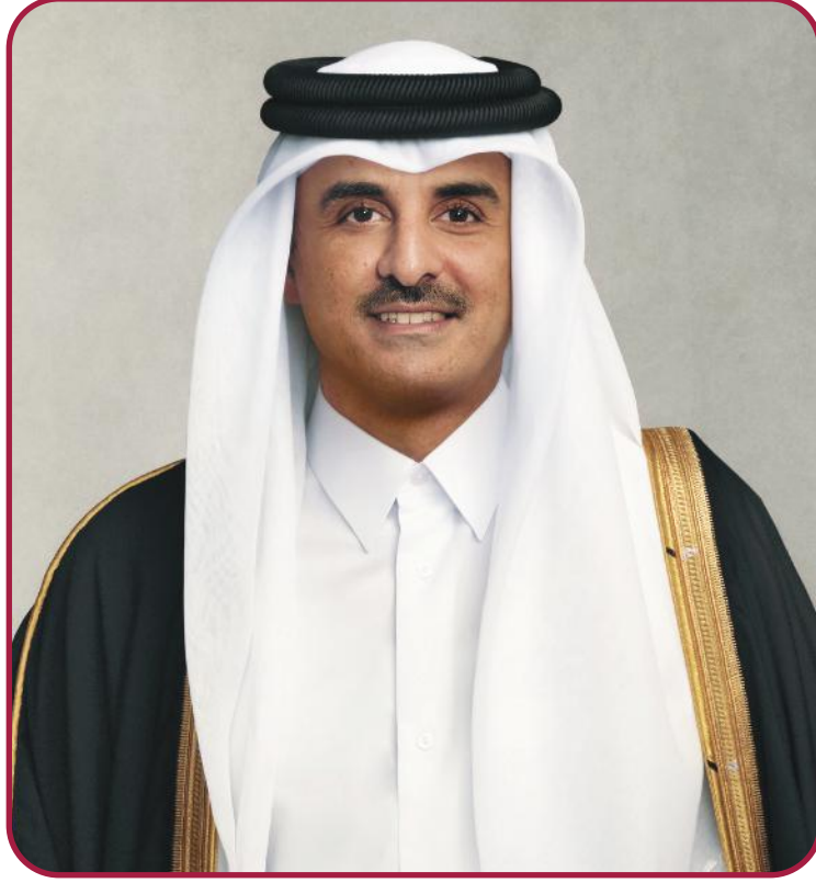
حضرة صاحب السمو الشيخ تميم بن حمد آل ثاني أمير دولة قطر