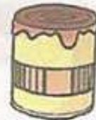
paint طلاء / دهان

• يستمع التلاميذ إلى أسماء اللوازم الفنية مرة أخرى بدون ترتيب، ويقومون بالإشارة إلى الصورة التي تعبر عن