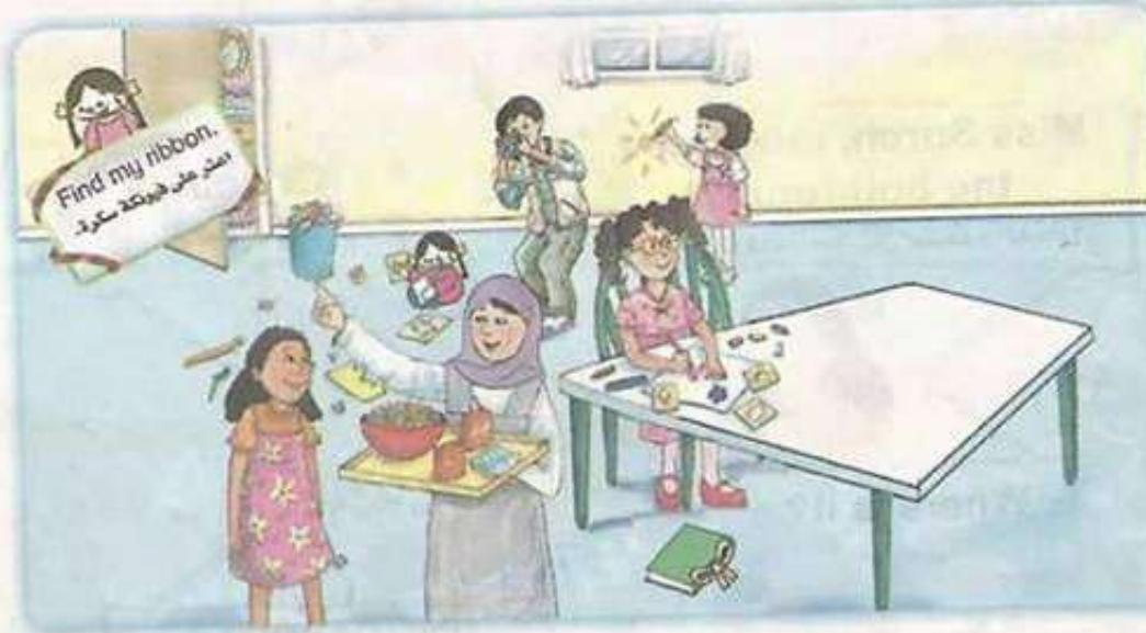
* the spine of the book on the floor. * كتب الحقيبة المعلق على الأذن.

* تستخدم (May I) لطلب الإذن . وتكون الإجابة بـ (Of course)