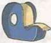
tape شريط لاصق