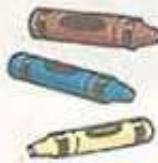
crayons أقلام شمع ملونة