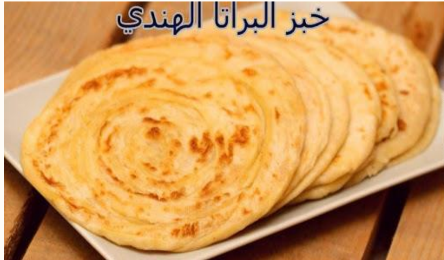
خبز البراتا الهندي

نَوْعٌ مِنَ الْمَخْبُوزَاتِ الَّتِي عُرِفَتْ فِي شِبْهِ الْقَارَةِ الْهِنْدِيَّةِ، ثُمَّ انْتَشَرَتْ فِي دَوْلِ الْخَلِيجِ الْعَرَبِيِّ، تُصْنَعُ الْبَرَاثَا مِنْ طَحِينِ الْقَمْحِ الْكَامِلِ، وَتُقْلَى فِي السَّمْنِ أَوْ الزَّيْتِ، وَتُلَفُّ عَلَى شَكْلِ شَطِيرَةٍ؛ لَيْسَهُلَ تَنَاوُلُهَا.