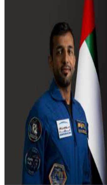
سلطان سيف النيادي رائد فضاء

كان سلطان النيادي احتياطياً لهزاع المنصوري في أول مهمة علمية مأهولة إلى الفضاء لدولة الإمارات العربية المتحدة، على متن محطة الفضاء الدولية في 25 سبتمبر 2019 تحت شعار “طموح زايد”.