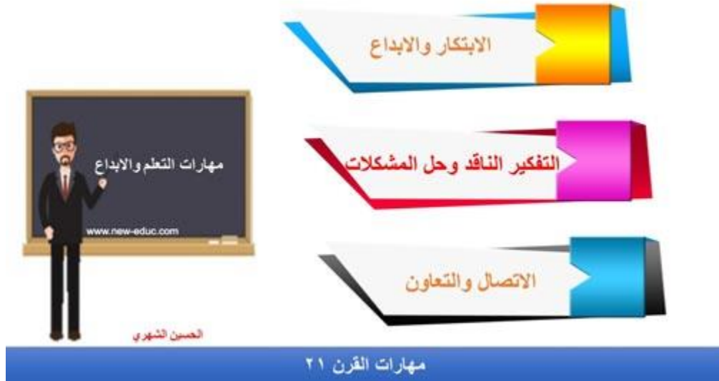
شكل (1) مهارات التعلم والإبداع

يحولون الأفكار الابتكارية إلى مساهمات ملموسة ومفيدة للمجال الذي سيطبق في الابتكار.