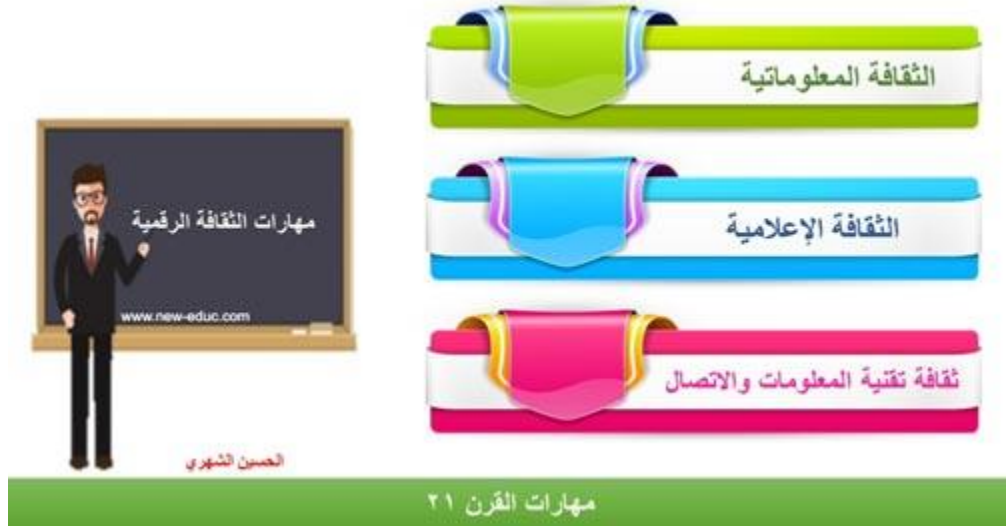
شكل (2) مهارات الثقافة الرقمية