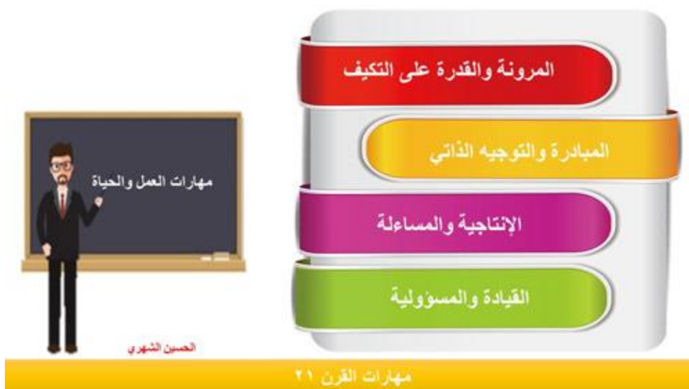
شكل (3) مهارات العمل والحياة