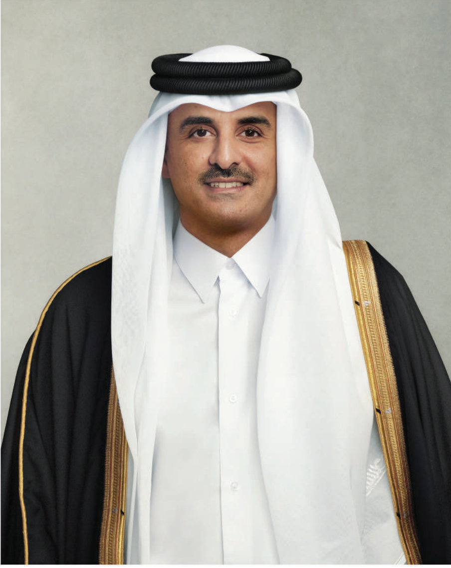
حضرة صاحب السمو الشيخ تميم بن حمد آل ثاني أمير دولة قطر

قَسَمًا بِمَنْ رَفَعَ السَّمَاءَ * قَسَمًا بِمَنْ نَشَرَ الضِّيَاءَ قَطَرٌ سَتَبْقَى حُرَّةً * تَسْمُو بِرُوحِ الْأَوْفِيَاءِ سِيرُوا عَلَى نَهْجِ الْأَلَى * وَعَلَى ضِيَاءِ الْأَنْبِيَاءِ قَطَرٌ بِقَلْبِي سِيرَةٌ * عِزٌّ وَأَمْجَادُ الْإِبَاءِ قَطَرُ الرِّجَالِ الْأَوَّلِينَ * حُمَاتُنَا يَوْمَ النَّدَاءِ وَحَمَائِمُ يَوْمِ السَّلَامِ * جَوَارِحُ يَوْمِ الْفِدَاءِ