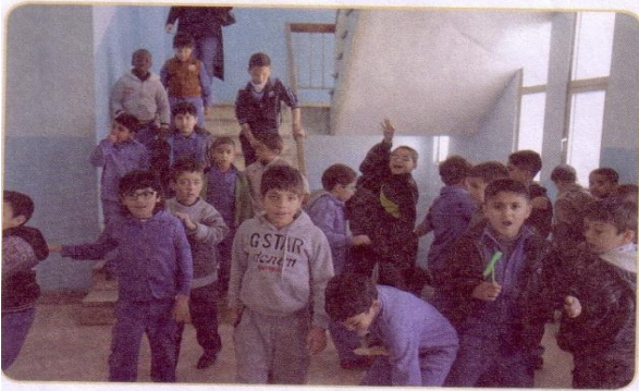
(٤) طلاب ينزلون الدرج بغير انتظام.