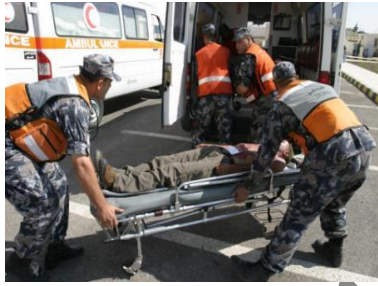
رجال الدفاع المدني