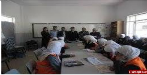
مجموعة أصدقاء الدفاع المدني