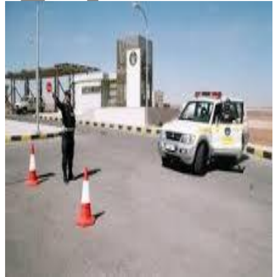
(( ج )) دورية خارجية