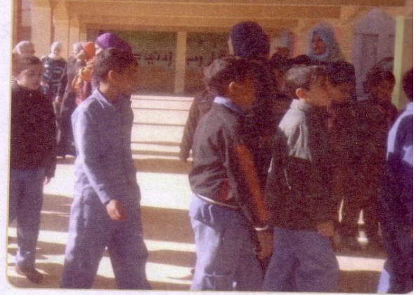
(١) طلاب يدخلون الصفوف بانتظام بعد انتهاء الطابور الصباحي.