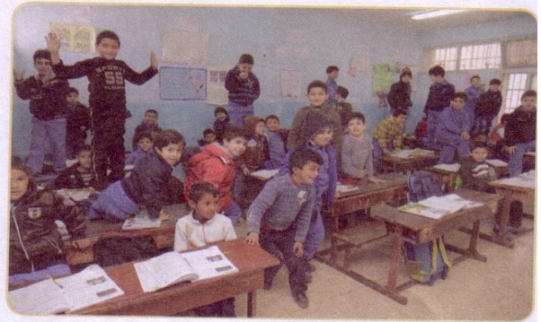
(٣) طلاب يقفون فوق المقاعد.