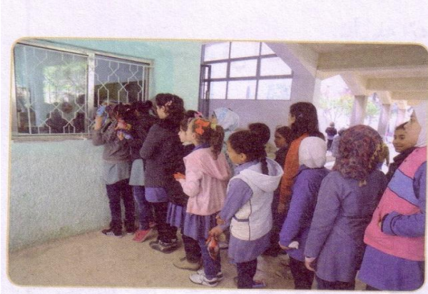
(٢) طالبات يصطففن بانتظام للشراء من المقصف المدرسي.