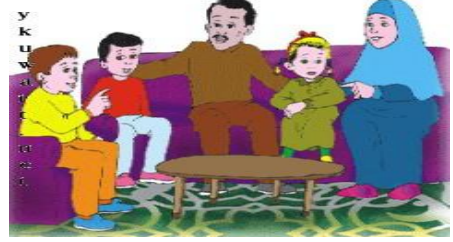
الوالدان و افراد الاسرة