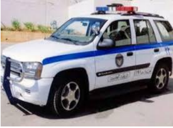
(( ب )) سيارة نجدة