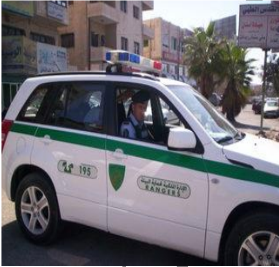
(( د )) مركبة شرطة البيئة