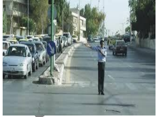
(( أ )) شرطي سير