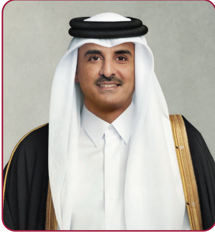
حضرة صاحب السمو الشيخ تميم بن حمد آل ثاني أمير دولة قطر