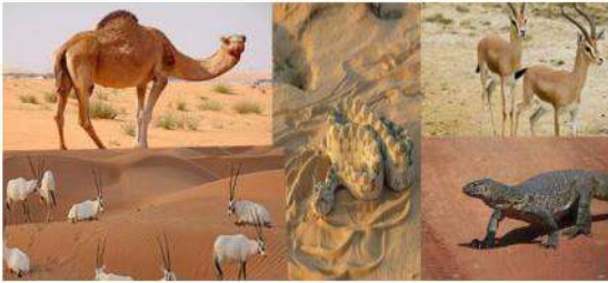
مجتمع حيوي في الصحراء