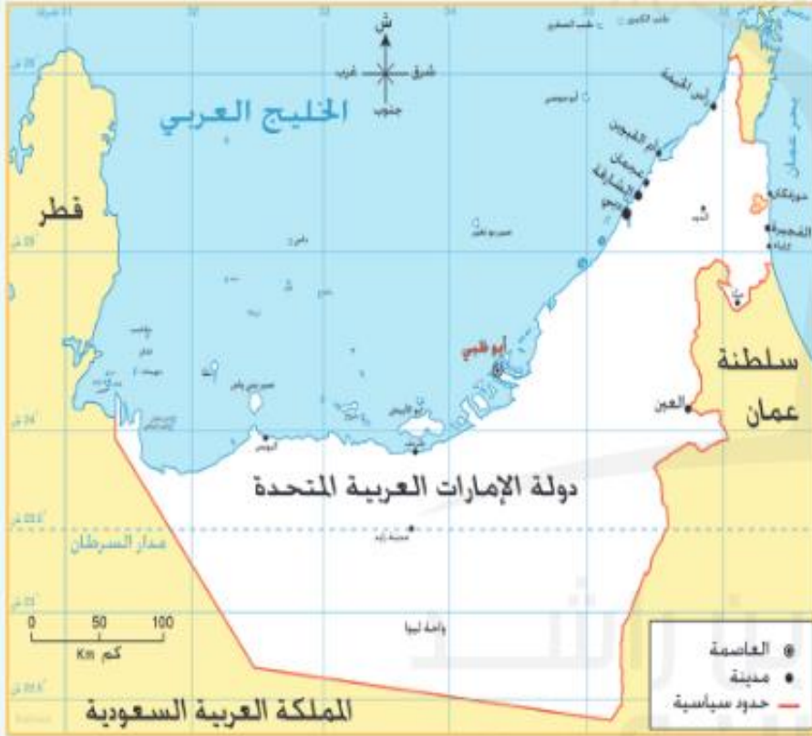
خريطة دولة الإمارات العربية المتحدة