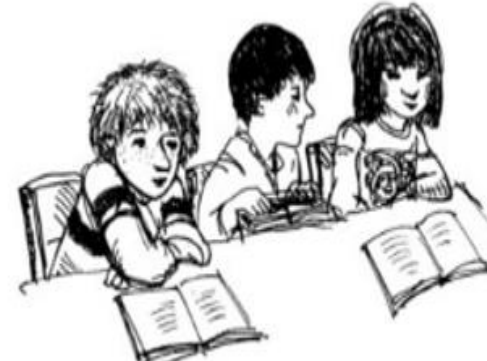
أصدقاء دراسة جدد