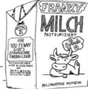
يحب القراءة + جمع الصور + الفواكه المحفوظة