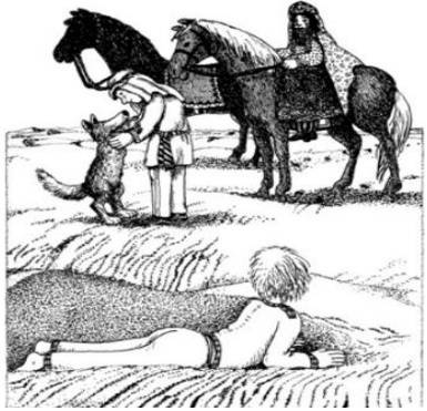
تدخل الحلم بالواقع