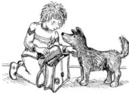
حنوه على الكلب / الوفاء