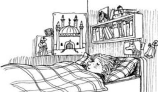
إكمال القصة بالحلم