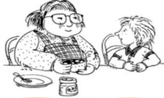
عطف السيدة يشكى