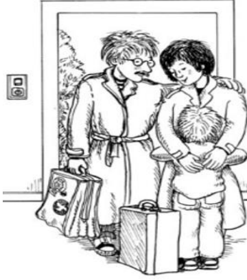
سفر الوالدين لأسبوع