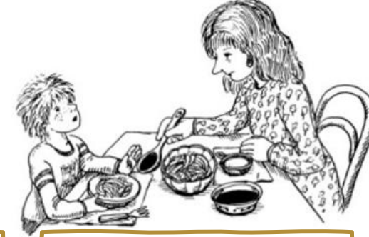
حزم السيدة يعقوب