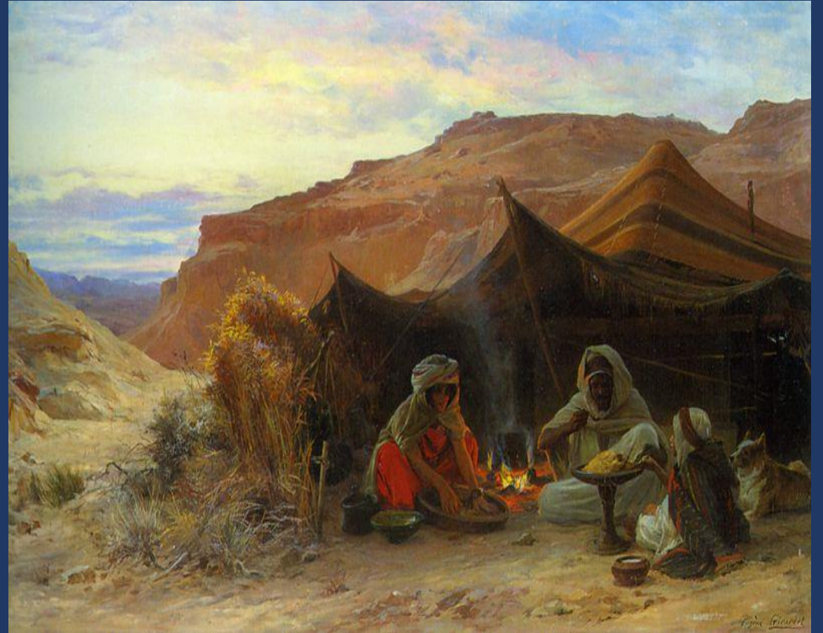
قبيلة ١ خلف