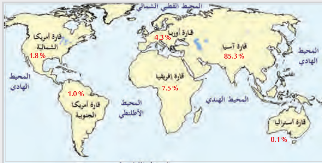
شكل (1) نسب الأقليات المسلمة في قارات العالم

تأمل الخريطة الآتية التي توضح نسب الأقليات المسلمة حول العالم.