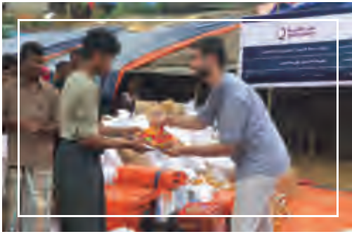
مساعدات قطر الخيرية لمسلمي ميانمار

أحرص على التعاطف مع قضايا المسلمين ودعمهم من خلال المؤسسات والمنظمات الرسمية.