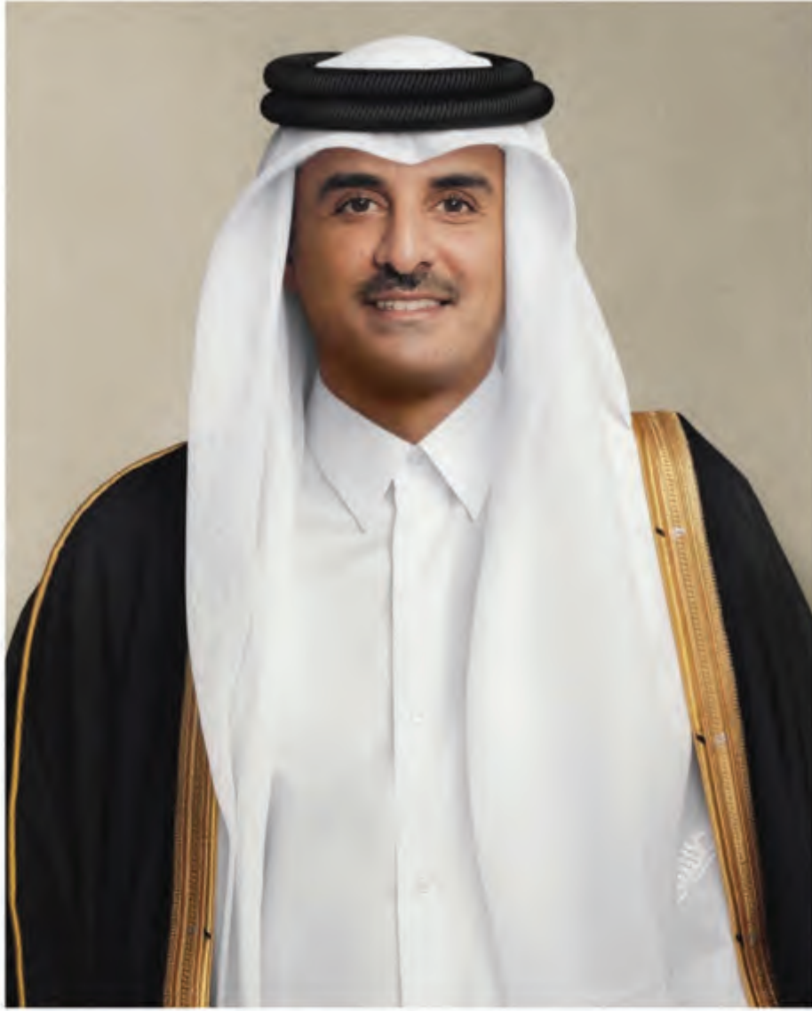
حضرة صاحب السمو الشيخ تميم بن حمد آل ثاني أمير دولة قطر