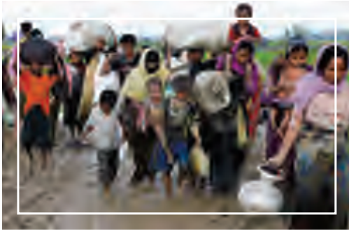
التهجير الإجباري لمسلمي الروهينجا