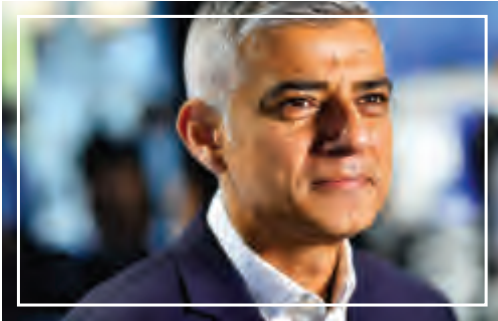
رئيس بلدية لندن صادق خان

منح الأقليات قوانين مستقلة في الأحوال الشخصية والحرية في اختيار الزي المناسب والمحافظة على الهوية.