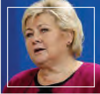
رئيسة وزراء النرويج

اعتذرت رئيسة وزراء النرويج في اليوم العالمي للفجر 8 أبريل 2015م عن سوء المعاملة التي تعرض لها الفجر قبل الحرب العالمية الثانية وبعدها، ووصفت ما حدث بأنه صفحة سوداء من تاريخ البلد ووعدت بدفع تعويضات لهم، حيث منع النرويجيون الفجر من العودة إلى البلاد بعد سفرهم للخارج في الثلاثينات، ومُنعوا أيضاً من العودة إلى النرويج بعد الحرب لمدة عشر سنوات.