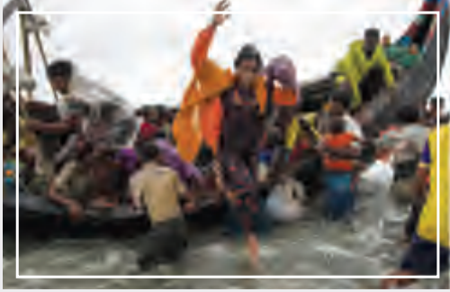
أطفال لاجئون من أبناء الروهينجا يقفون وسط مياه الفيضانات