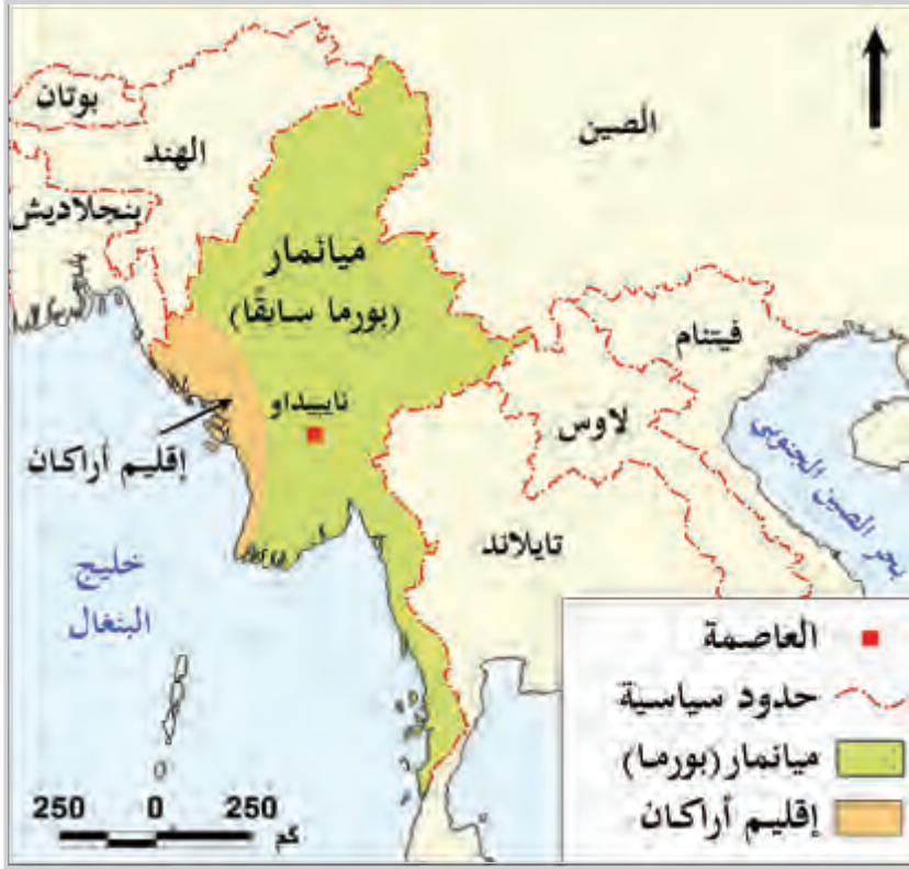
شكل (4) خريطة ميانمار

تُعد إحدى جمهوريات جنوب شرق آسيا، ودخلها الإسلام في القرن التاسع الميلادي وقامت بريطانيا بضم بورما "ميانمار" عام 1885م بعد انتصارها على البورميين، وألحقها بحكومة الهند، واستمرت ولاية هندية حتى عام 1937م، ثم استقلت عن بريطانيا في يناير 1948م.