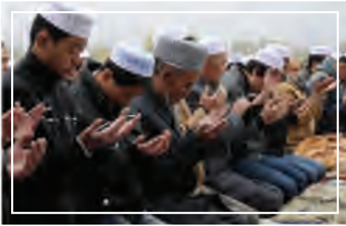
أقلية مسلمة في شرق آسيا

هي مجموعة من الأفراد قليلة العدد متميزة ثقافيًا أو عرقيًا تعيش وسط جماعة أكبر داخل الدولة لها ملامح اجتماعية وثقافية ودينية تختلف عن بقية أفراد المجتمع ، ولا يكاد يخلو أي بلد في العالم من وجود الأغلبية والأقليات المختلفة.