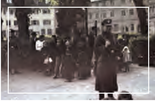
الفجر والتمييز العنصري

يشكو الفجر من التمييز العنصري ضدهم فالمجتمعات التي عاشوا فيها رفضت قبولهم كأقلية ذات حقوق ، فتعرضوا إلى موجات من الاضطهاد والإبادة في تاريخهم ، وصدرت القوانين ضد كل من يرتبط بالفجر بأي شكل من الأشكال ، فقد أجبر مئات الآلاف من الفجر للعمل لدى النبلاء كعبيد وذلك لفترات