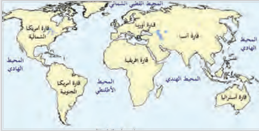
شكل (3) أماكن تواجد الفجر