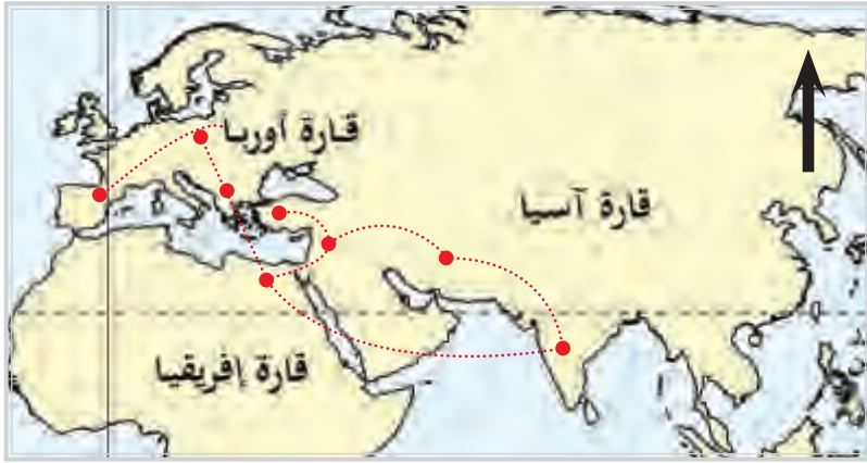
شكل (2) خط سير الفجر من الهند إلى أوروبا

كانت إيران محطتهم الأولى من السفر بعد هجرتهم من الهند، إلا إنهم لم يستقروا؛ نتيجة لظروف مختلفة، لهذا وصلوا الرحيل حتى وصلوا الأناضول والمناطق العربية في حدود القرن التاسع ميلادي، ثم رحل قسم منهم إلى مصر وتركيا وشمال أفريقيا، ووصلت معظم الهجرات لأوروبا، وبعد أن كانوا يسيرون