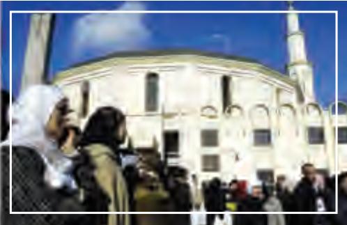
المسجد الكبير في بروكسيل - بلجيكا

تمارس الأقليات المسلمة في بعض الدول للعديد من الحقوق منها :