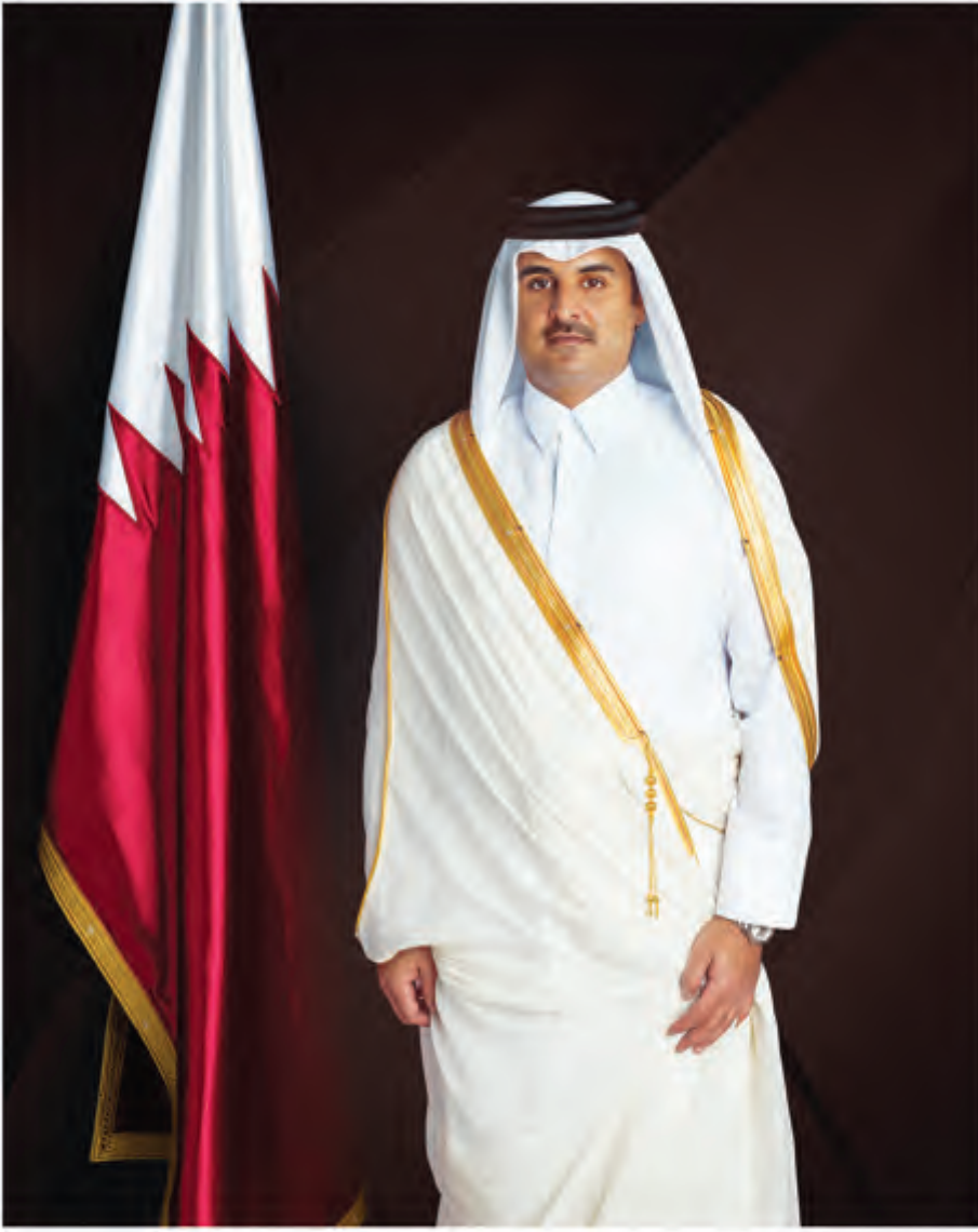
حضرة صاحب السمو الشيخ تميم بن حمد آل ثاني أمير دولة قطر