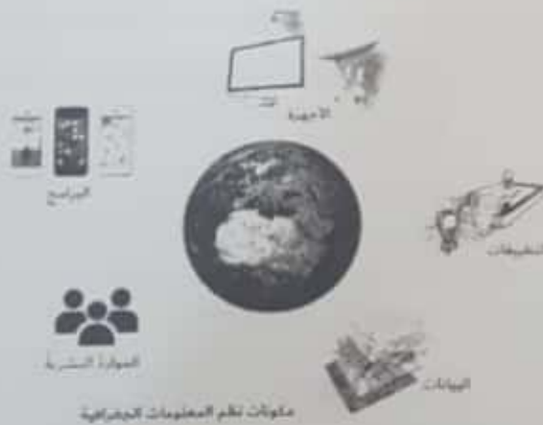
مكونات نظم المعلومات الجغرافية