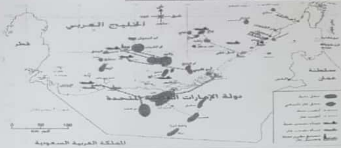
المملكة العربية السعودية