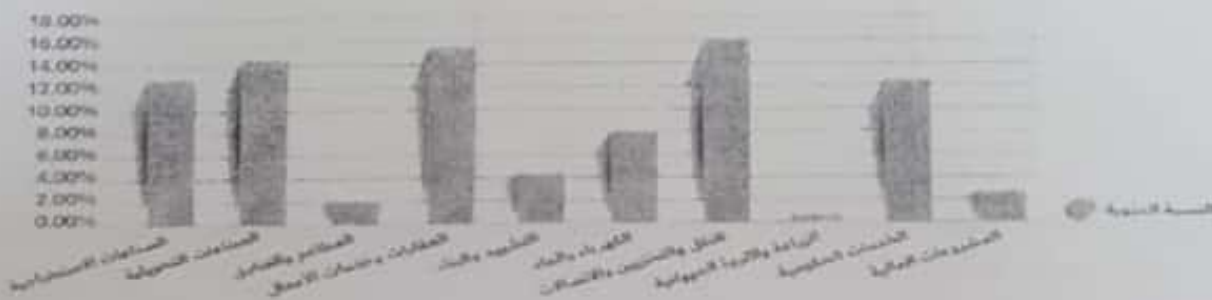
مساهمة القطاعات غير النفطية في الناتج المحلي الإجمالي