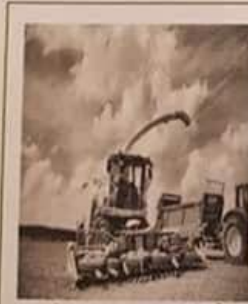
آلة لحصد المحصول