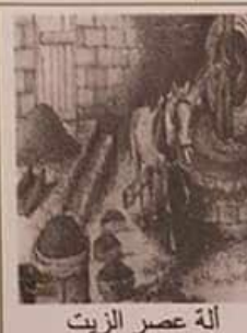
آلة عصر الزيت