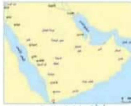
أسواق العرب في شبه الجزيرة العربية

كان للعرب أسواق تجارية مشهورة، يقصدها في شهور السنة، ويحضرها تجار العرب، فيتبادلون السلع فيما بينهم، ومن أشهرها سوق عكاظ. ولم تكن هذه الأسواق للتجارة فقط، بل كانت أسواقاً للآداب والإبداع والإنجاز الذي تشهده الآن دولة الإمارات العربية المتحدة مثل مبادرة القراءة والتي تهدف إلى تشجيع القراءة بشكل مستدام ومتنظم، عبر نظام متكامل من المتابعة للطلاب طوال العام الأكاديمي، إضافة إلى مجموعة كبيرة من الحوافز المالية والتشجيعية للمدارس والطلاب والأسر والمشرفين المشاركين من جميع أنحاء العالم العربي.