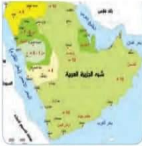
انضمام المناطق للدولة الإسلامية